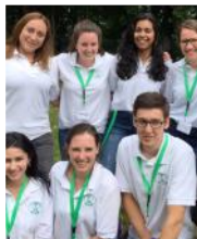
Spezielles Team aus der Schweiz für die Kinderarbeit

فريق من سويسرا متخصص لتقديم رسالة الإنجيل للأطفال